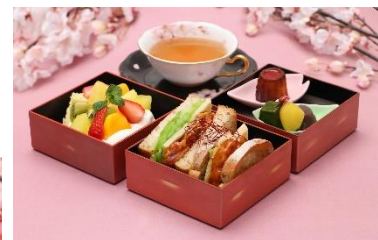
↑写真上 <桜たまたま箱(春)>