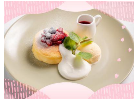
<甘酸っぱいベリーのパンケーキ>