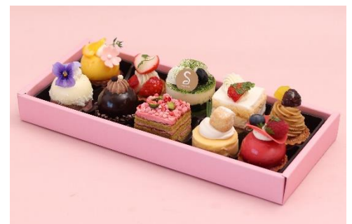
<春限定 プティフル>